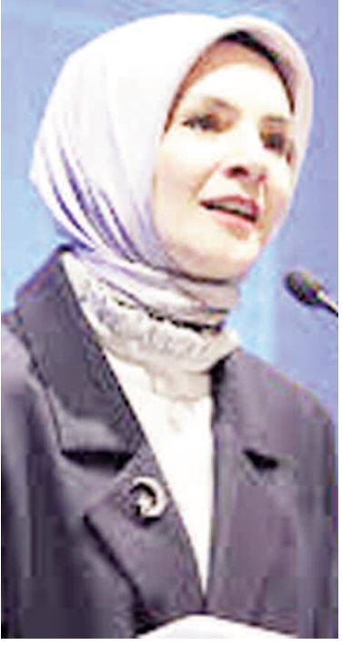
Mahinur Özdemir Göktaş

Aile ve Sosyal Hizmetler Bakanı Mahinur Özdemir Göktaş, Düzenli Doğal Gaz Tüketim Destek Programı'nda yeni yılın ilk ödemesinin başladığını belirterek, 529 bin 162 hak sahibine toplam 303,1 milyon lira ödeme yapacaklarını açıkladı.