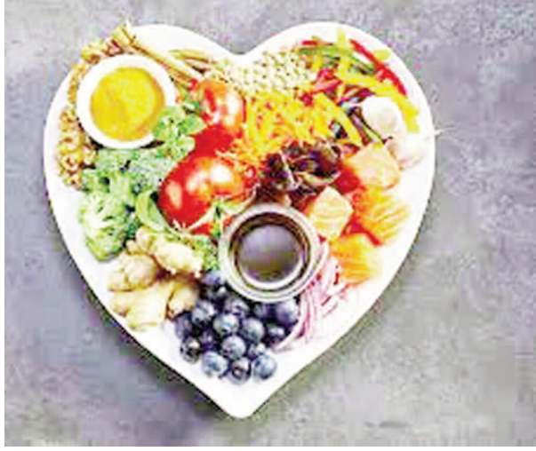
KIŞ AYLARINDA D VİTAMİNİ SEVİYELERİ DÜŞER