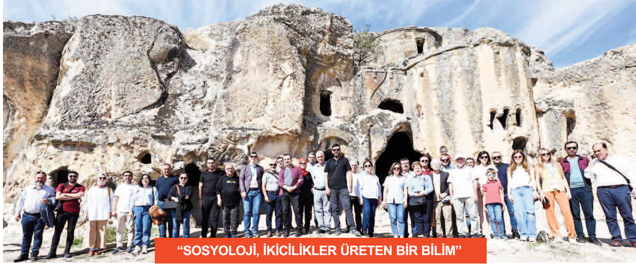
“SOSYOLOJİ, İKİCİLİKLER ÜRETEBİR BİLİM”