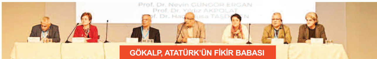
GÖKALP, ATATÜRK’ÜN FIKIR BABASI

fırsatımız oldu. Düşünce mi yapıyı belirler yoksa yapı mı düşünceyi belirler. Ama Osmanlı Türk modernleşmesi 19. yüzyılın son çeyreği, 20. yüzyılın ilk çeyreği o kadar çok hızlı koştu ki Ziya Gökalp gibi nice düşünürler bu değişimi anlamaya, açıklamaya, meşrulaştırmaya, formüle etmeye ve teorileştirmeye çalıştı. 1913-1914 yıllarında Türk Yurdu’nda yazdığı ‘Türkleşmek, İslamlaşmak ve Muasırlaşmak’ ile ilgili makalelerinde medeniyet kavramı dine isnat ederken, 1918 yılında kitap haline geldiğinde din iken şimdi medeniyet ilme isnat ediyor diyerek artık kendi medeniyet tanımını da değiştirmek zorunda kalıyor. Türk sosyal, siyasal ve tarihsel gerçekliği o kadar hızlı akıyor ki düşün adamları bunu yakalamak, anlamak ve anlatmak konusunda da aynı nefes nefese devam ediyor. Ziya Gökalp’in Türk sosyolojisinin başında koyduğu heyecanı biz de hocalarımızla ele ala gidiyoruz.”