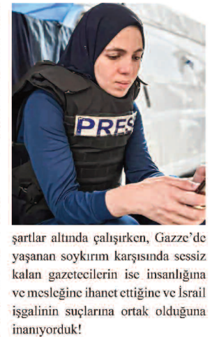
şartlar altında çalışırken, Gazze'de yaşanan soykırım karşısında sessiz kalan gazetecilerin ise insanlığın ve mesleğine ihanet ettiğine ve İsrail işgalinin suçlarına ortak olduğuna inanıyorduk!

Gazeteci arkadaşlarımızla işgale ve soykırıma karşı birlikte direndik. Herkes elinde ne imkân varsa en iyi şekilde değerlendirip paylaşırken, yaşanan soykırımı canları pahasına duyurmaya gayret gösteriyorduk. Onlara her zaman mazlumların sesinin onların ellerine verilmiş bir emanet olduğunu söyledim. Biz bu