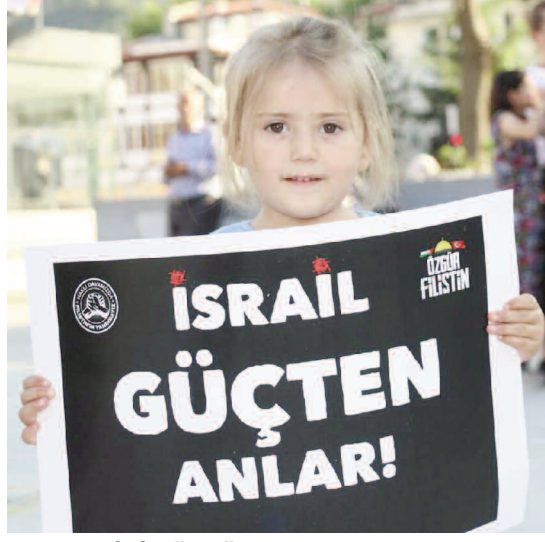
BATI İKİ YÜZLÜ DAVRANMAKTADIR!

Karataş açıklamasında şu ifadelerle yer verdi; “İsrail’in 7 Ekim’den itibaren Gazze’de başlattığı işgal tam bir yıl geçmesine rağmen maalesef ki tüm acımasızlığı ile devam etmektedir. Yakın tarihin en acımasız ve en vahşi işgali; bugüne kadar on binlerce mazlumun canını almıştır. Siyonist rejim kadın, çocuk, yaşlı demeden hunharca bir şekilde katliamlar yaptı, yapmaya da devam ediyor. Hastaneleri, camileri, kiliseleri, okulları ve mülteci kamplarını dahi hedef alan terör devleti; tüm dünyanın gözü önünde bütün savaş suçlarını işliyor. İsrail hapishanelerinde Filistinli mazlumlara uygulanan işkence ve tecavüzler ise artık uygulanan zulmün ne denli korkunç olduğunu gözler önüne sermektedir. Evet! Gazze’de bir soykırım vardır ve bu soykırım tüm dünya devletlerinin gözü önünde yapılmaktadır. Srebrenitsa’da, Karabağ’da, Yemen’de, Doğu Türkistan’da ve nice mazlum ülkelerde yaşananlar bugün Gazze’de tekrar etmektedir. İnsanlığın, vicdanın ve uluslararası hukuk ilkelerinin yok sayılarak işlendiği bu katliamlar, şimdiden tarihe kara bir leke olarak geçmiştir. İsrail; Lübnan’a yaptığı son saldırılarıyla da barışı, huzuru ve uluslararası hukuku hedef alarak tüm dünyayı büyük bir kaosa çekmektedir.”