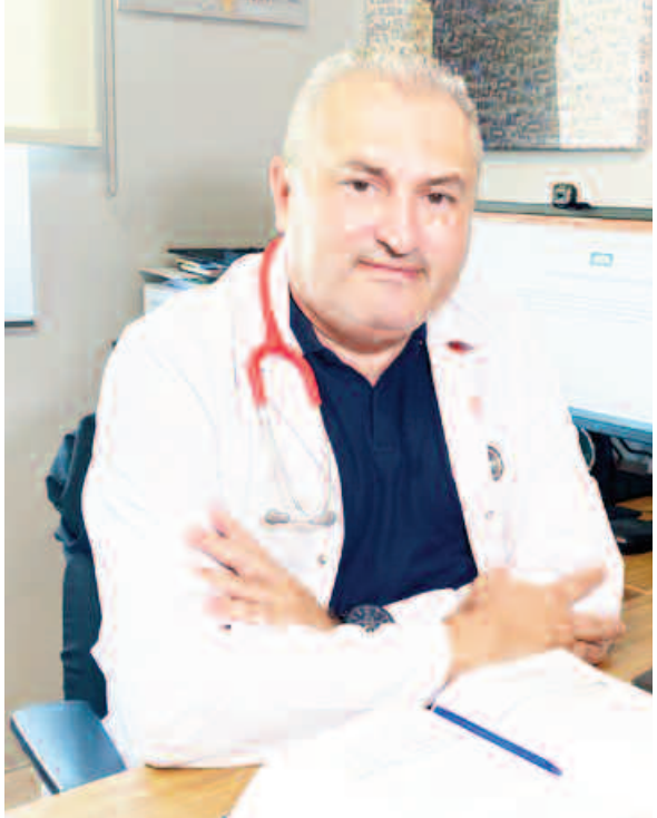
"İlk 6 ay boyunca sadece anne sütüyle beslenmeli"