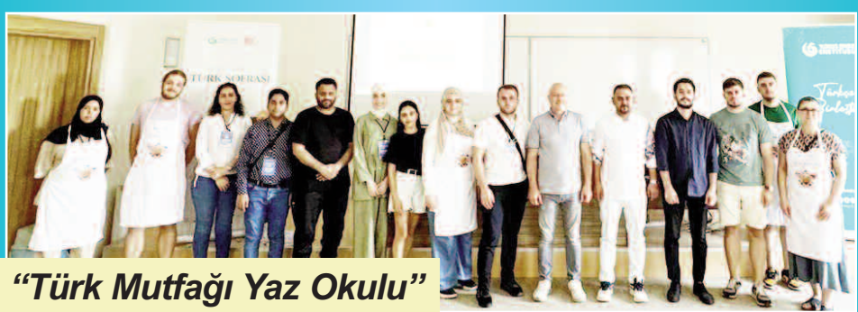
"Türk Mutfağı Yaz Okulu"