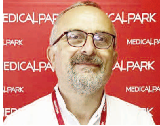
Maymun çiçeği virüsü hastalığından korunma yolları