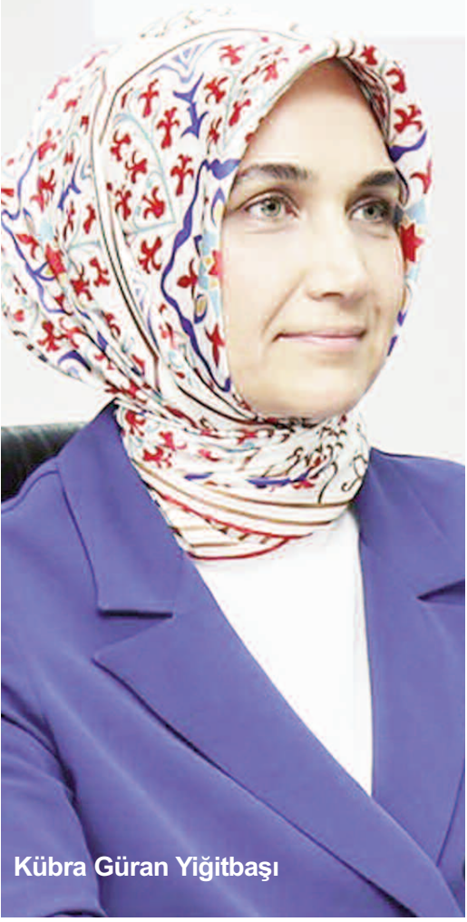
Kübra Güran Yiğitbaşı

Kamu yatırımlarının sektörel dağılımına ilişkin de bilgiler veren Vali Yiğitbaşı şöyle konuştu. "İlk sırada 344 proje ile haberleşme ve ulaştırma, ikinci sırada 295 proje ile diğer kamu hizmetleri ve üçüncü sırada da 135 proje ile tarım sektörü yer almaktadır. Tüm yatırımcı kuruluşların önceki yıllarda yapmış oldukları özverili çalışmalarının devam edeceği kanaatiyle emeği geçen herkese teşekkür eder, başarılı çalışmalarının devamını dilerim." Vali Yiğitbaşı'nın konuşmasının ardından yatırımcı kuruluşların Bölge Müdürleri Afyonkarahisar genelinde devam eden yatırımlar hakkında ayrıntılı sunumlar yaptılar. Talep ve isteklerin alınması, önceki toplantıda alınan kararların sonucunun değerlendirilmesi ve görüş alışverişinde bulunulması ile toplantı sona erdi. >>IBRAHİM ARTIÇ