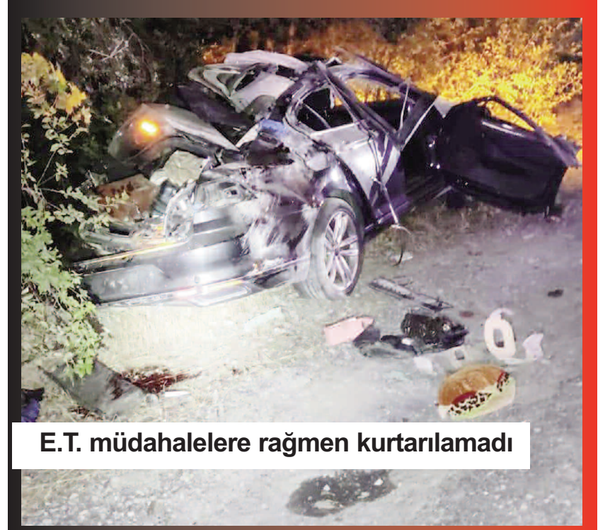
E.T. müdahalelere rağmen kurtarılamadı