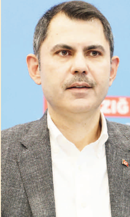
"Yılsonuna kadar toplamda en az 200 bin konutu teslim edeceğiz"

11 ili ayağa kaldırmak için gece gündüz çalıştıklarını belirten Kurum, "24 saat esası ile gece gündüz ziyaretlerimizi gerçekleştiriyor, bir saatin ve dakikanın dahi kıymetli olduğunu anlayışıyla çalışmalarımızı yapıyoruz. Şuana kadar 11 ilimizde 283 bin yuvamız, konutumuzun inşa sürüce başlatılmıştır. 4 bin 500'e yakın köyümüzde; köy evlerinin yapımı, kırsal kalkınmanın sağlanması ve oradaki özgün mimari doğrultusunda bakanlığımız konutların yapımını gerçekleştirmektedir. Şu ana kadar; toplamda 76 bin yuvamızı kardeşlerimize teslim ettik. Yılsonuna kadar toplamda en az 200 bin konutu teslim edeceğiz. İnşallah bur çerçevede her ay 25-30 bin konutun teslimiyle birlikte ailelerimiz evlerine kavuşana kadar durmadan duraksamadan çalışacağız. Kardeşlerimize verdiğimiz sözleri tutacağız. 2025 yılı sonuna kadar, 11 ilde 6 Şubat depremi nedeniyle evine girmeyen hiçbir afetzedede vatandaşlarımız kalmayacak. Elazığ özelinde 6 Şubat depreminde 3 bin 93 yeni yuvamızı ve iş yerimizi kurduk, milletimizin duasını aldık. Şimdi devam eden 13 bin 500 konutumuzun inşası, vatandaşlarımızın talepleri doğrultusunda yapmış olduğumuz görüşmeler çerçevesinde hızlı bir şekilde devam etmektedir. Onları da hızlı bir şekilde tamamlayacağız" şeklinde konuştu. >>İHA