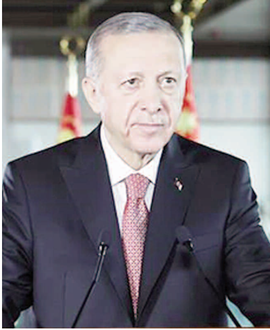
bulunuyoruz. 6A'yla birlikte Türksat'ın bölgeye yönelik uydu hizmeti ihracatının da ciddi manada artacağına inanıyoruz. Yerli ve milli haberleşme

Cumhurbaşkanı Recep Tayyip Erdoğan, Türkiye'nin ilk yerli ve milli haberleşme uydusu Türksat 6A'nın uzaya fırlatma törenine video mesaj gönderdi. Cumhurbaşkanı Erdoğan, "Bugün ülkemiz ve milletimiz açısından yeni bir gurur vesilesine daha hep beraber şahitlik ediyoruz. Yerli haberleşme uydumuz Türksat 6A'yı az önce uzaya fırlattık. Ülkemizin uzaydaki istikbali için büyük önem taşıyan 6A projesindeki alt sistemlerin, uydu yer istasyonu ve yazılımların yüzde 81'den fazlasını milli imkânlarla Türkiye olarak kendimiz ürettik. 2 buçuk sene önce uzaya fırlattığımız 5B uydumuzda olduğu gibi 6A'da da SpaceX firmasının Falcon 9 roketini tercih ettik. Sayın Elon Musk ve SpaceX firmasıyla çeşitli alanlarda tesis ettiğimiz iş birliğinin güçlenmesinden memnuniyet duyuyoruz" dedi. Önüne çıkarılan tüm engellere ve kısıtlamalara rağmen Türkiye'nin uzaydaki varlığını artırdığını ifade eden Cumhurbaşkanı Erdoğan, "Milli uzay programımızdaki ana hedeflerimizden biri olan ilk insanlı uzay misyonumuzu kısa süre önce gerçekleştirdik. Türksat 6A'yla uydu üretiminde yeni bir safhaya geçmiş