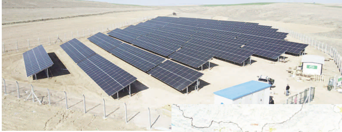
AFYONLU ÜRETİCİLERE YILDA 1 MİLYON LİRA EK GELİR

Afyonkarahisar Bolvadin ilçesinde, Dünya Bankası Türkiye Sulama Modernizasyonu Projesi kapsamında yer altından pompaj yöntemiyle sulanan tarım arazilerinin elektrik enerjisi ihtiyacını Güneş Enerjisi Santrali kurularak çok daha düşük maliyetle sulanması sağlanacaktır. İmalatların devam ettiği projede % 90 fiziki gerçekleşme oranı aşılrken DSİ Genel Müdürü Mehmet Akif BALTA, projeyi bitirmek için adeta zamanla yarıştıklarını söyledi. Projenin, 2024'ün ilk yarısında kullanıma açılmasını hedeflediklerini açıkladı. Afyonkarahisar Bolvadin ilçesi GES projesinde şu anda çalışmaların hızla devam ettiğini vurgulayan DSİ Genel Müdürü Mehmet Akif BALTA, "Bolvadin Afyonkarahisar İl'inin Doğusunda İl merkezine 61 km uzaklıktadır. Proje sahası Akarçay Havzası'nda olup, etrafı yüksek dağlarla çevrili kapalı havza durumundadır. Su kaynağı yeraltı sularıdır. Sulama şebekeleri 3. Kısım 2008, 5. Kısım 2010, 6. Kısım ise 2018 yılında tamamlanarak işletmeye açılmıştır. 3 adet sulama alanında 10 adet pompa ile toplam büyüklüğü 5.290 dekar olan tarım arazisi sulanmaktadır. Bolvadin İlçesi GES (Güneş Enerjisi Santrali) kurulumu Bolvadin İlçe Merkezi tarım arazileri ve merkez ilçeye bağlı Dipevler köyü tarım arazilerinde daha önce sulama sahaları tamamlanmış olan 3, 5 ve 6. Kısım Yer altı sulama Şebekelerini kapsamaktadır" diye konuştu.