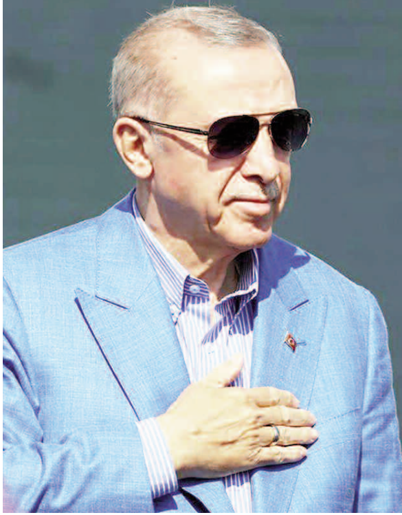
"AKLA BAKAR MISINIZ?"

31 Mart Mahalli İdareler Seçimleri'ne 30 günün kaldığını dile getiren Erdoğan, "Antalya'nın ilçeleri gümbür gümbür geliyor. Buğulu gözlerle Akdeniz ufuklarını süzen Antalya, turizmiyle, tarımıyla, ticaretiyle hepsinden önemlisi insanıyla ülkemize değer katıyor, huzur veriyor. Antalya artık sadece turizmin ve tarımın değil, diplomasi'nin küresel yıldızlarından biri haline dönüşüyor. Dün başlayan ve 3'üncüsü Antalya Diploması Forumu bu yükselişin işaretlerinden biridir. Antalya artık sadece Türkiye'nin değil, artık dünyanın bütünleştiği bir yer. Bu tür organizasyonlar şehrimizin marka değerinin artmasına da katkı sağlıyor. Antalya Diploması Forumu'nda dünyanın dört bir yanından gelen katılımcılara ülkemizi ve küresel meselelere ya anlatma imkanı bulduk" diye konuştu.