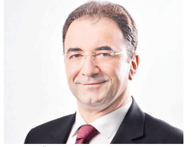
RUYLA YOĞRULMUŞ EVLATLARIYIZ

BİZLER BU MEMLEKETİN EDEP VE AHLAK HAMU-