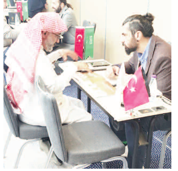
17 FİRMADAN 19 İŞ İNSANI HEYETTE YER ALDI

Türkiye, 2023 yılında 183 ülke ve gümrüklü bölgeye doğal taş ihracatı yapmışken, ihracatta ilk sırada yüzde 3'lük artışla 432 milyon dolarlık tutarla Çin Halk Cumhuriyeti yer aldı. 2022 yılında doğal taş ihracatında lider olan Amerika Birleşik Devletleri 2023 yılında yüzde 15'lik azalışla 388 milyon dolarla ikinci sıraya geriledi. Hindistan'a doğal taş ihracatımız yüzde 17'lik artışla 159 milyon dolara çıkarken, doğal taş ihracatında yüzde 41'lik artışla en büyük artış hızını yakaladığımız Suudi Arabistan'a 114 milyon dolarlık doğal taş ihracatı başarıyla gösterdik. Beşinci sıranın sahibi 104 milyon dolarlık taleple Irak oldu.