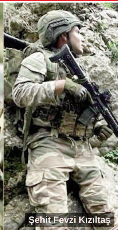
Şehit Fevzi Kızıltaş