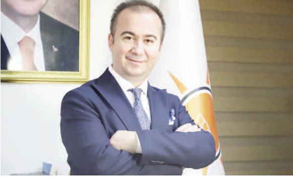
AK PARTİ'DE 100 ADAY ADAYI BAŞVURU YAPTI