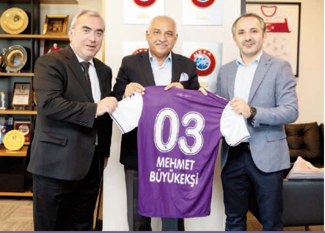
TFF Başkanı Büyükeşşi'ye Afyonspor forması hediye ettiler

TFF 2. Lig ekiplerinden Afyonspor yönetim kurulu üyeleri ziyaret ettikleri Türkiye Futbol Federasyonu Başkanı Mehmet Büyükeşşi'ye Afyonspor forması hediye ettiler.>>7'DE