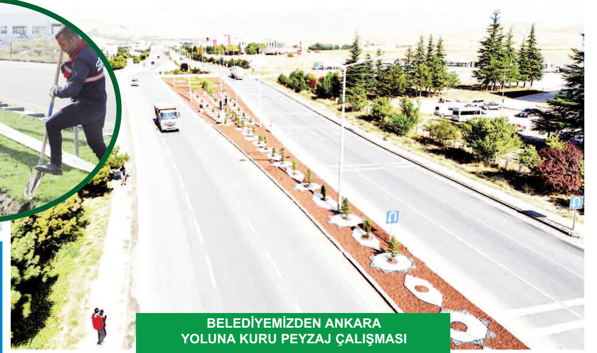
BELEDİYEMİZDEN ANKARA YOLUNA KURU PEYZAJ ÇALIŞMASI

Belediye Park ve Bahçeler Müdürlüğü ekipleri yeşil alan çalışmalarının yanı sıra kuru peyzaj da yaparak Afyonkarahisar'ın güzelliğine güzellik katıyor. Güzel görünümün yanı sıra kuru peyzaj çalışmaları sulama gerektirmediği için su kaynaklarının tasarrufu sağlanıyor. Uygulamanın hayata geçtiği güzergâhlardan birisi de Ankara Yolu oldu. Afyonkarahisar- Ankara istikametinde bulunan orta refüj geometrik desenli renkli dolomit taşlar ile süslendi. Bu sayede hem tasarruf hem de sürücü güvenliği temin edildi. Sınırlı su kaynakları ve küresel iklim değişikliği nedeniyle su tasarrufu sağlayacak uygulamalara öncelik veren Belediye, su kaynaklarını daha bilinçli ve verimli şekilde kullanarak hem doğayı korumaya hem de ülke ekonomisine katkıda bulunmaya devam ediyor. >>HÜDAYI ACAR