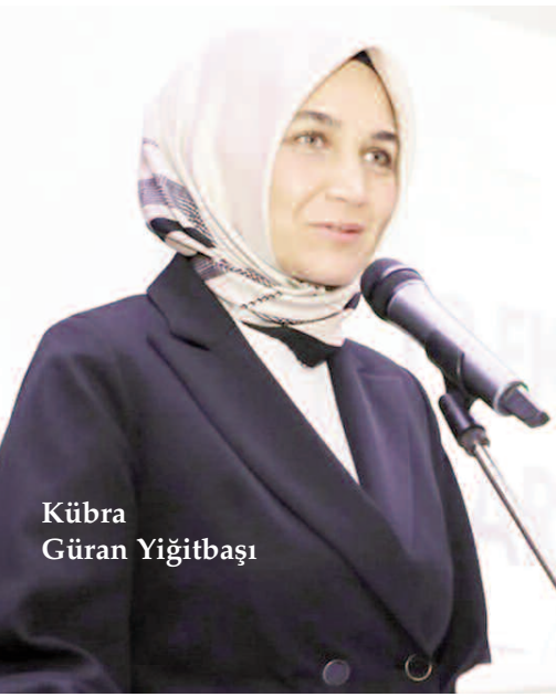
Kübra Güran Yiğitbaşı

İlçe programlarıyla muhtarları zaman zaman dinlediğini ve taleplerin çözümü noktasında her zaman el ele verdiklerini kaydeden Vali Yiğitbaşı, "Dünya ne kadar ileri gitse, teknoloji ne kadar gelişse ve ne kadar dijitalleşsek de, muhtarlarımızın sırtladığı yükü taşıyacak bir teknoloji üretilmeyecektir. Bu anlamda, siz muhtarlarımıza minnettar oluşumu ifade etmek isterim. Biz de Valilik olarak, farklı ilçelerimizin köy ve mahalle muhtarlarıyla periyodik olarak bir araya gelecek temel sorun ve ihtiyaçları muhtarlarımızdan dinlemeye, gerekli birimlerimiz aracılığıyla taleplerin giderilmesine ve ülkemizi muhtarlarımızla el ele yönetmeye devam edeceğiz. 1829 yılından bu yana devletimizin sahadaki gören gözü işiten kulağı olan, demokrasimize yaptıkları katkılarla milletimizin temsil kabiliyetini artıran ve millet iradesinin gerçekleşmesinde yeri doldurulamayacak bir işlevi olan muhtarlarımıza, burada buldukları için teşekkür ediyor ve iş birliğimizin günden güne artmasını temenni ediyorum" şeklinde konuştu. Vali Yiğitbaşı'nın konuşmasının ardından toplu fotoğraf çekimi ve hediye takdimi yapıldı. Muhtarlara teşekkür eden Vali Yiğitbaşı, çalışmalarında kolaylıklar diledi. >>HÜDAYİ ACAR