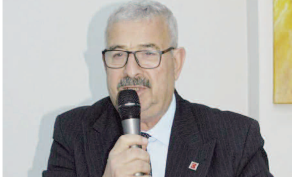
ABD'NİN HEDEFİ ORTADOĞUDA "YAHUDİ KÜRDİSTAN DEVLETİ" KURMAK