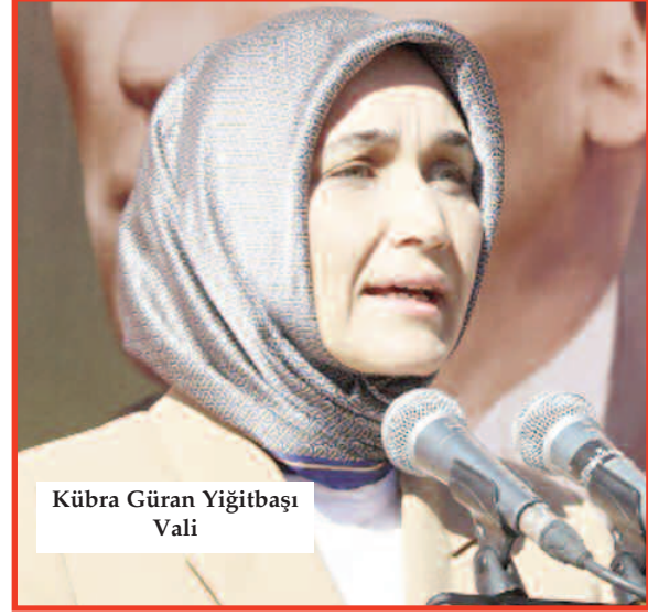
Kübra Güran Yiğitbaşı Vali

Afyonkarahisar Valisi Kübra Güran Yiğitbaşı, 2023-2024 Eğitim Öğretim Yılı İlköğretim Haftası Açılış Programı kapsamında Mareşal Fevzi Çakmak İlkokulunda düzenlenen programda öğrencilerle ve velilerle bir araya gelerek önemli mesajlar verdi.