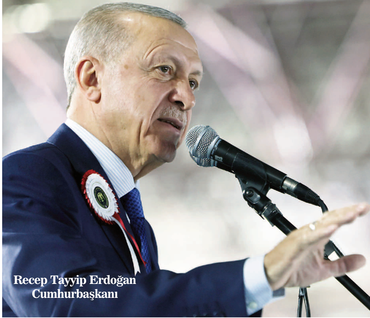
Recep Tayyip Erdoğan Cumhurbaşkanı

15 Temmuz'un önemini bir kez daha hatırlatan Cumhurbaşkanı Erdoğan, "Demokrasi tarihine altın harflerle kazınan 15 Temmuz kıyamımızı 85 milyon olarak hep beraber yeniden hatırladık. Kayıplarımızın dinmeyen sızısı yüreğimizi kavururken maruz kaldığımız ihanetin büyüklüğü karşısında öfkemiz daha da arttı. Hem tanklara karşı meydan okumanın gururunu hem de kendi silahıyla vurulmanın acısını beraber yaşadık. Üstünden değil 7 yıl 70 yıl da geçse 15 Temmuz'u unutmayacağımızı tüm dünyaya bir kez daha ilan ettik. Şehitlerimizin aziz hatıralarına daima sahip çıkacağız. 15 Temmuz gecesi 253 vatan evladını şehit verdik. Şehitlerimiz arasında 63 kahramanımız bulunuyordu. Sadece Gölbaşı'nda 51 kahra-