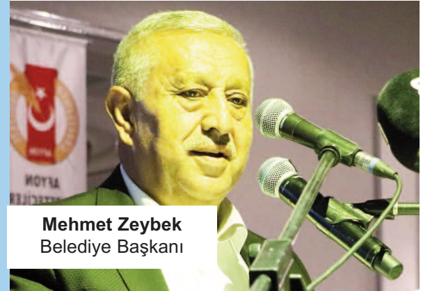
Mehmet Zeybek Belediye Başkanı