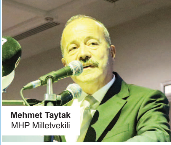
Mehmet Taytak MHP Milletvekili