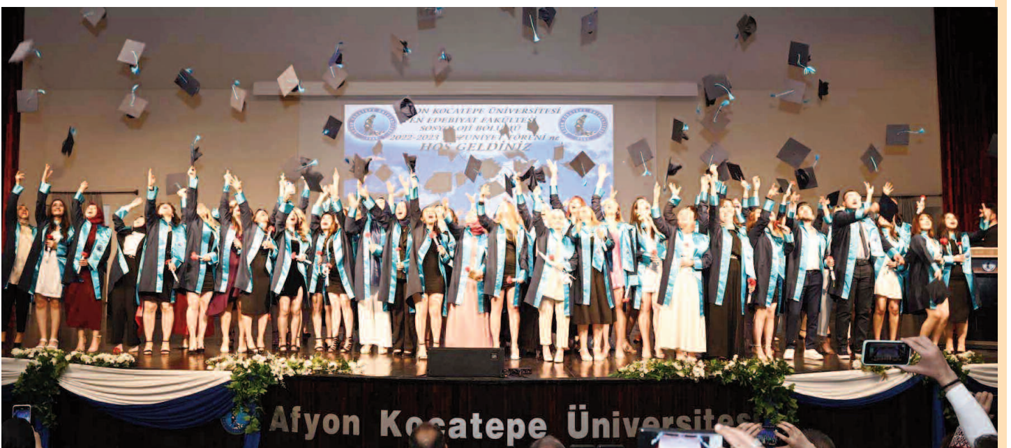
Afyon Kocatepe Üniversitesi

leri sizlersiniz. Fedakarlıklarınızdan dolayı sizleri kutluyorum. Bugünü doyusuya yaşayın