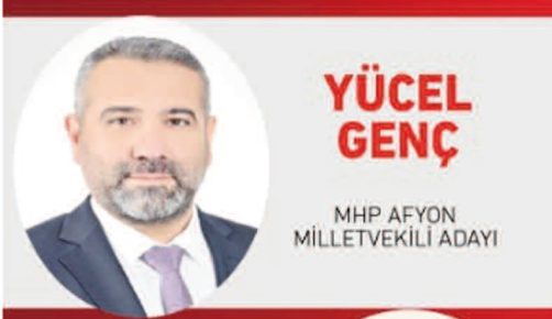
YÜCEL GENÇ MHP AFYON MİLLETVEKİLİ ADAYI