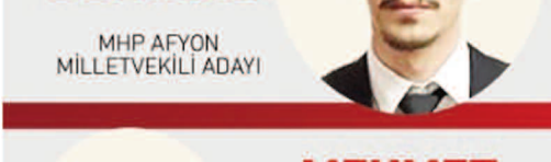
MEHMET EMRE DEMİRAL MHP AFYON MİLLETVEKİLİ ADAYI