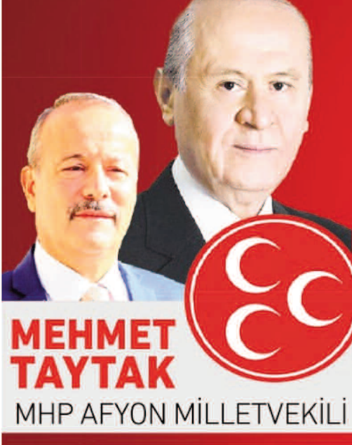
MEHMET TAYTAK MHP AFYON MİLLETVEKİLİ

Zafer müzesi restorasyonunda ikinci aşamaya geçildi HABERİ 8'DE