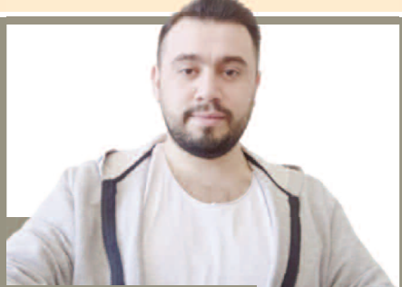
Finans Dünyasında İki Ayı Yaklaşım 6'DA

Afyonkarahisar Valiliği kentin değerlerini tanıtmaya devam diyor. Afyonkarahisar'ın Bolvadin ve Çay ilçe sınırları içerisinde kalan Eber Gölü'nde her yıl olduğu gibi bu yıl da baharın gelmesi ile Eber Sarısı (Vuralia turcica- Thermopsis turcica) açtı. >>5'TE