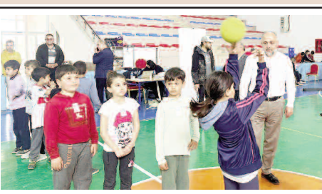
Şuhut'ta gençlerin spor yetenekleri keşfediliyor 7'DE