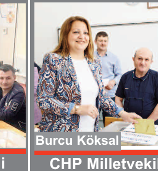
Burcu Köksal CHP Milletvekili