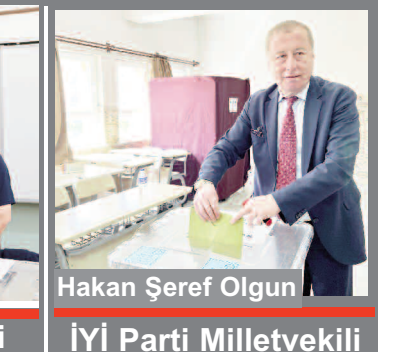
Hakan Şeref Olgun İYİ Parti Milletvekili