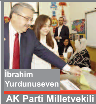
İbrahim Yurdunuseven AK Parti Milletvekili