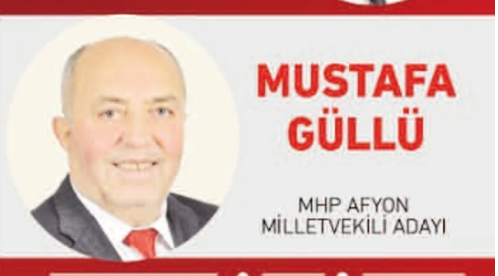
MUSTAFA GÜLLÜ MHP AFYON MİLLETVEKİLİ ADAYI