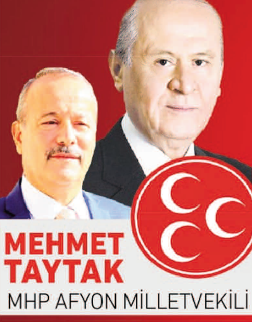
MEHMET TAYTAK MHP AFYON MİLLETVEKİLİ

KOCATEPE - TÜRKELİ - ODAK - ANA HABER GAZETELERİ, KARAHİSAR TV, RADYO HİSAR (100.3) - RADYO TEK (91.1), karahisartv - Kocatepe Gazetesi TV - kocatepegazetesi.com - afyonturkeligazetesi.com odakgazetesi.com - anahabergazetesi.com - adreslerinden ulaşabilirsiniz